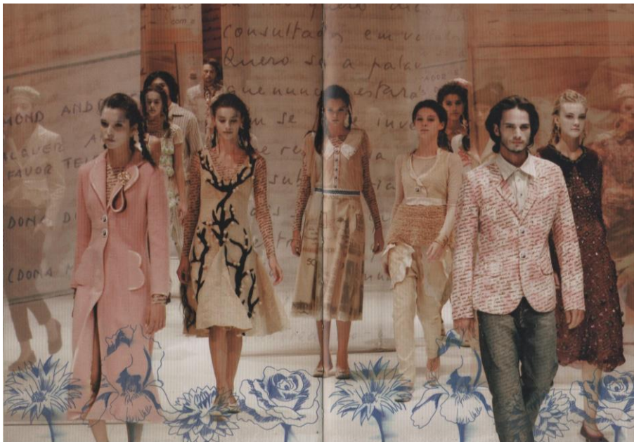
Figura 01: Um recorte da coleção “Todo mundo e ninguém” (FRAGA, p.92 e 93), 2007.

Nas peças da coleção está presente a tradução icônica, a qual se pauta no princípio de similaridade de estrutura. Um exemplo desta tradução pode ser visto na figura 2. Na saia do look, foi estampada a imagem de Drummond, impressa em uma nota de dinheiro (50 cruzados novos), criando uma analogia entre o objeto imediato e sua representação, neste caso, o homem Drummond (Objeto Imediato) e a imagem criada para a estampa (desenho de Drummond). Uma equivalência entre o real e o parecido. A tradução icônica desta peça da coleção é isomórfica, pois busca analogia nas formas, apresentando linguagens diferentes que são traduzidas para o mesmo sistema, ou seja, representam as formas que decodificam a figura de Drummond, permitindo identificá-lo. A imagem estampada na saia identifica Drummond, mas não é Drummond, e sim, a representação dele.