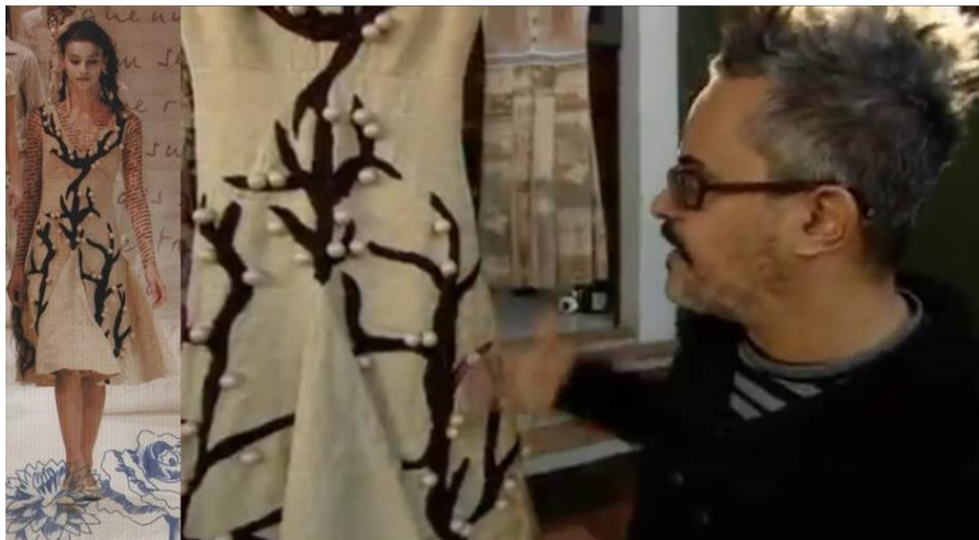
Figura 03: Vestido que representa uma jabuticabeira (FRAGA, p.92), 2007e (print da entrevista Entrelinhas), 2009.

Em entrevista para o programa Entrelinhas (2009), a repórter questiona o estilista sobre a relação da jabuticabeira com Carlos Drummond de Andrade. Fraga, de pronto, responde: